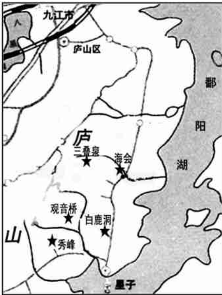
图1 庐山山南地区简图

区域原以亚热带常绿阔叶林和亚热带针叶林为主,常绿阔叶植物有:苦槠栲、青栲、青冈栎、天竺桂、樟树、大叶楠、红楠、白楠、紫楠、厚皮香和油茶等;林下常绿灌木有:尖叶茶、细齿叶柃、杨桐、乌饭树、马银花、石头棵子和茴香等。草本植物有芒萁、狗脊蕨和庐山石韦等。此外还有亚热带针叶林—马尾松林等。但由于人类的活动,多变成人工栽培植被,森林沦为灌丛、草丛,只有局部保留次生天然林 [2] 。