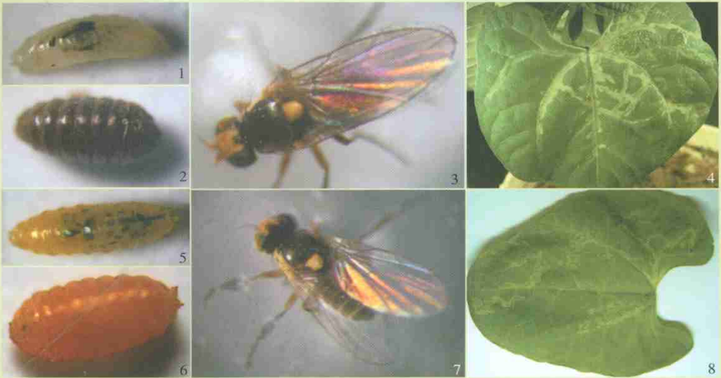
1~4. 南美斑潜蝇 1. 老熟幼虫 2. 发育第6 d的老熟蛹 3. 成虫 4. 幼虫为害芸豆叶片形成潜道 5~8. 美洲斑潜蝇 5. 老熟幼虫 6. 发育第6 d的老熟蛹 7. 成虫 8. 幼虫为害芸豆叶片形成潜道