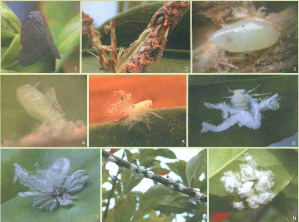
1. 成虫 2. 排列在枝条内的卵粒 3. 卵 4. 正在孵化的若虫 5. 初孵若虫 6. 老熟若虫 7. 若虫尾部蜡丝 8. 若虫为害枝条状 9. 若虫为害叶片状