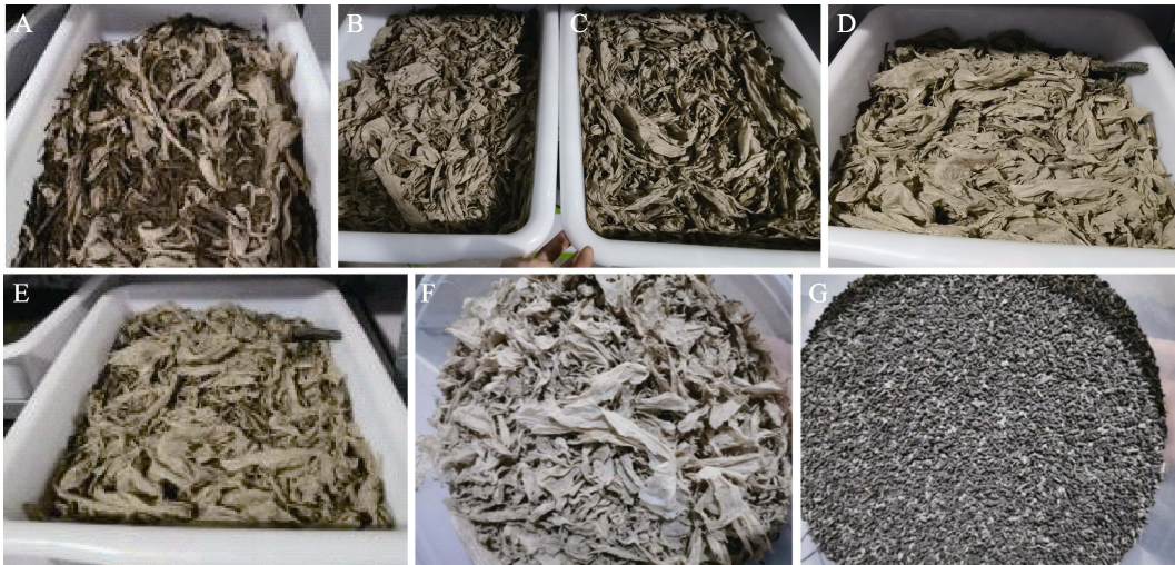
图 1 不同幼虫处理时间段物料状态